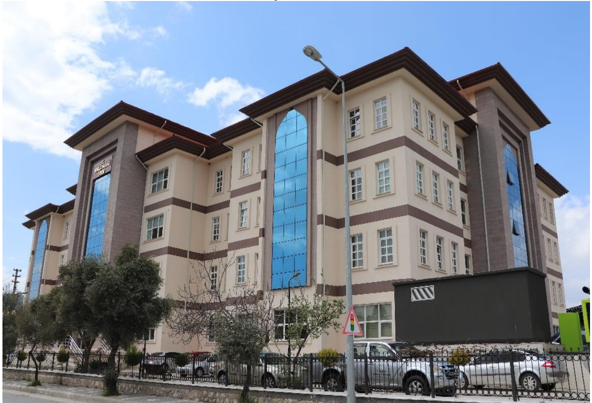
BİNANIN DIŞ CEPHEDEN GÖRSELİ