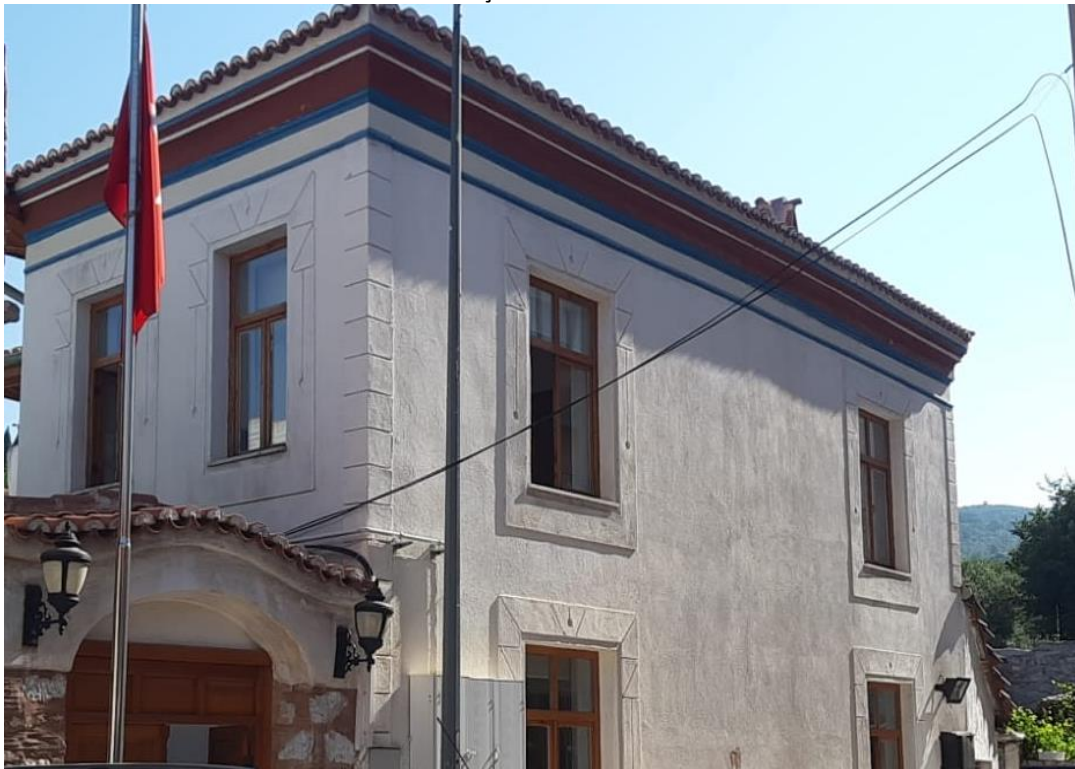
BİNANIN DIŞ CEPHEDEN GÖRSELİ